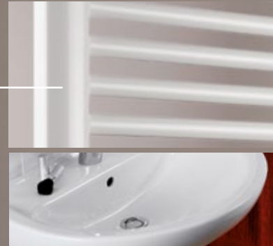
Mit den abgerundeten Kanten vorne fügt sich Turn perfekt in die Keramikserien von Richter+Frenzel, wie Europa und Optiset sowie anderen Keramikserien, wie z.B. Renova und Omnia, ein.