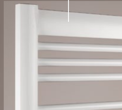
Hinter der ans Design angepassten Blende verschwindet die Befestigung des Turn.