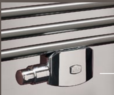
Hochwertiges Ventil mit Thermostatkopf und Blende rundet die Optik perfekt ab.