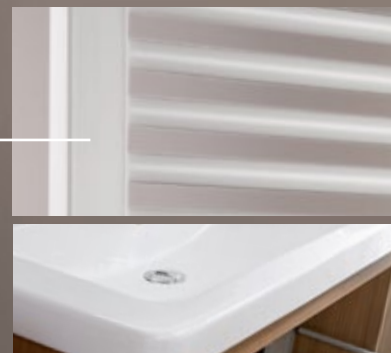
Sind die flachen Kanten nach vorne orientiert, passt der Heizkörper besonders gut zur Richter+Frenzel Keramikserie MyStyle sowie zu anderen Keramikserien, wie z.B. D-Code oder Starck 3.